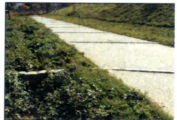
Allée piétonne et sa noue latérale