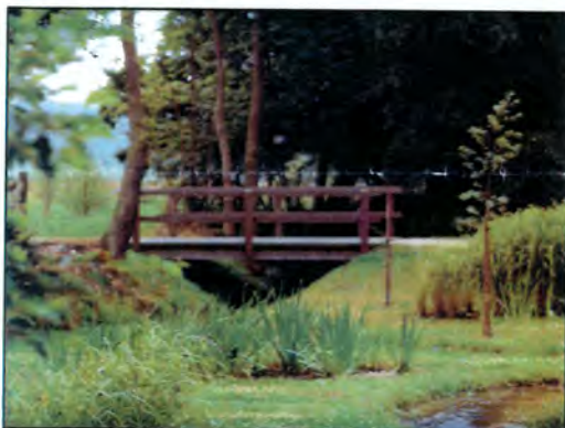
Intégration du traitement des eaux de pluie dans un ensemble paysager