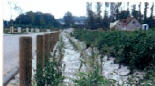
Une noue collectrice des eaux pluviales.

Textes et illustrations sans valeur prescriptive.