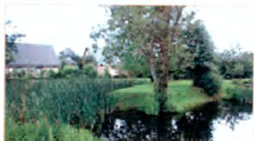
Un bassin filtrant collecte les eaux pluviales et participe à la qualité paysagère.