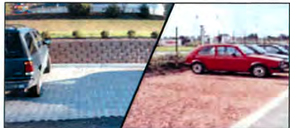
Illustrations non opposables